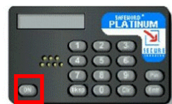
Front view of the new SafeWord Card