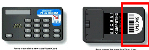
Front view of the new SafeWord Card